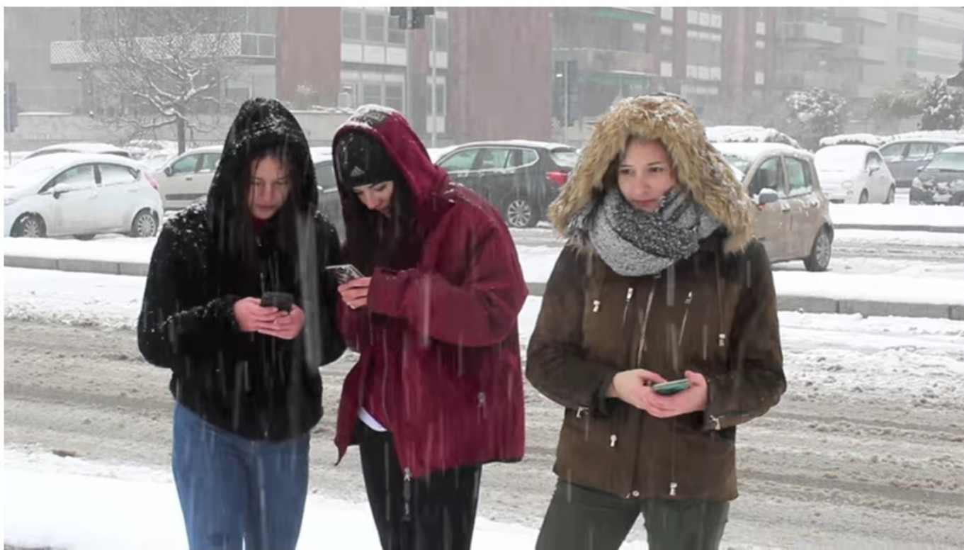
THE TIME IS NOW | Award Winning Short Film

Riječ je o oblicima nasilja, često grupno, u kojima se koristi fizička sila s namjerom povrijeđivanja: djeca se međusobno udaraju šakama i nogama, djevojčice se tuku i vuku za kosu dok drugi stoje sa strane i gledaju što se događa, bez interveniraju, osim komentiraju i potiču ih da nastave, dok oni sve to snimaju iza ekrana pametnog telefona. Video zapisi se zatim objavljuju na grupama i stranicama s hashtagom WorldStar, šire se po cijelom svijetu kako bi bili vidljivi i popularni, kako bi dobili lajkove, komentare i dijeljenja na videozapisu koji privlači pažnju.